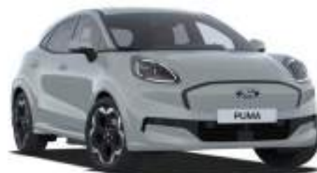
CACTUS GREY - lakier specjalny 2 500 zł Lakier niedostępny dla wersji BlueCruise