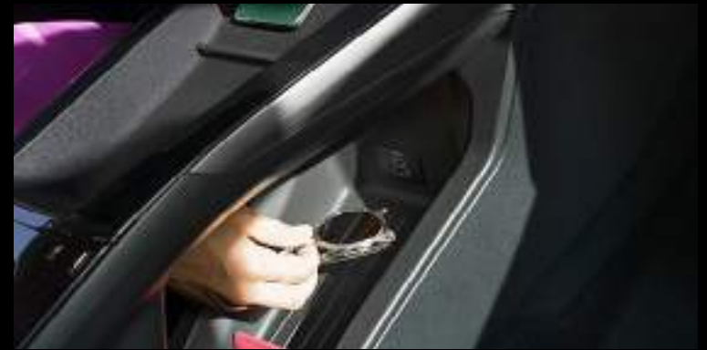
Bezprzewodowa ładowarka do smartfonów

Wyposażenie standardowe wszystkich wersji