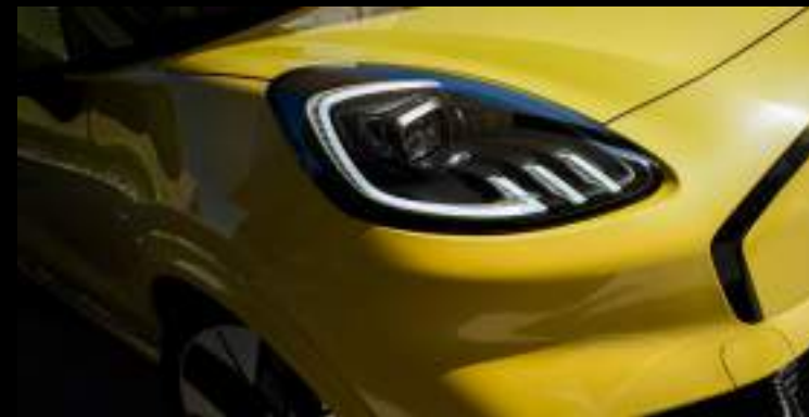
Reflektory Full LED - matrycowe, adaptacyjne Wyposażenie opcjonalne dla wersji Premium i BlueCruise