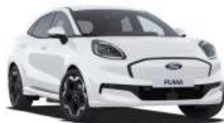
FROZEN WHITE - lakier zwykły 1 000 zł Lakier niedostępny dla wersji BlueCruise