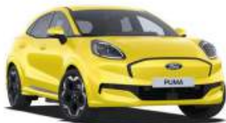
ELECTRIC YELLOW - lakier zwykły bez dopłaty Lakier niedostępny dla wersji BlueCruise