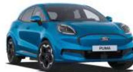
DIGITAL AQUA BLUE - lakier metalizowany specjalny 2 500 zł Lakier niedostępny dla wersji BlueCruise